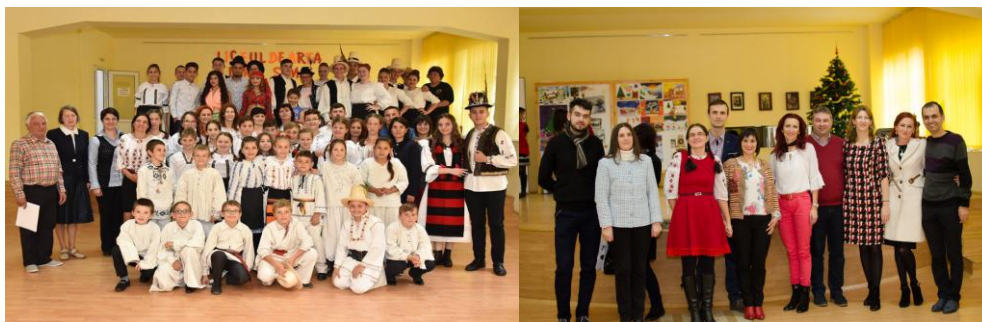
Imagini de la activitățile desfășurate în cadrul proiectului „Unitate în diversitate”

Un alt proiect cu tradiție în școala noastră este proiectul „Unitate în diversitate”, proiect înscris în Calendarul Activităților Regionale și Intejudețene 2020, realizat în colaborare cu parteneri locali și regionali. Proiectul își propune implicarea elevilor de liceu în activități după cum urmează: „Educația pentru valori - Holocaust - cum a fost posibil?”, Șezătoare tematică „Slobozi-ne gazdă-n casă!”, „15 pentru Eminescu și cultură”, Seri culturale la API, Concursul regional „Schimbarea e în noi!”, iar beneficiarii direcți ai proiectului sunt elevii din clasele a X-a și a XI-a de la Colegiul Tehnic „Alesandru Papiu Ilarian” Zalău și un eșantion de 15 elevi din fiecare școală din județele partenere. Considerăm că produsele finale ale acestui proiect au contribuit la dezvoltarea și îmbunătățirea unor competențe și abilități ale elevilor privind comunicarea și acceptarea interdependențelor într-o lume multiculturală.