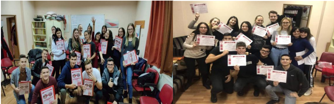
Imagini de la activitățile desfășurate în cadrul Programului „Liderii Mileniului Trei”

fiecărui elev beneficiar să se implice în propria formare și dezvoltare, să își formeze competențe și abilități de comunicare și management al conflictului, să lucreze în echipă, proiect pe care l-am continuat în semestrul al II-lea în mediul online. Câteva teme sugestive din programa modulului „Schimbarea e în noi” sunt: „Valorile din viața mea”, „Cum comunic cu ceilalți”, „Eu și... emoțiile mele”, „Am încredere în mine”, „Forța echipei: toți pentru unul și unul pentru toți”.