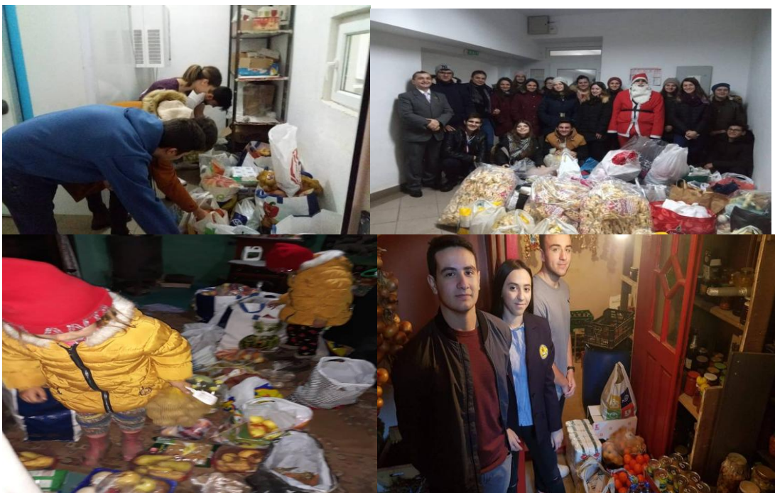
Imagini de la activitățile desfășurate în cadrul Strategiei Naționale de Acțiune Comunitară

Și în acest an am avut responsabilitatea de a coordona la nivelul școlii Comisia SNAC, în cadrul căreia s-au realizat acțiuni de voluntariat desfășurate pe parcursul întregului an școlar: „Săptămâna fructelor și legumelor donate”, „Poți fi și tu un Moș Crăciun”, „Pentru tine, un măștișor de la API!”.