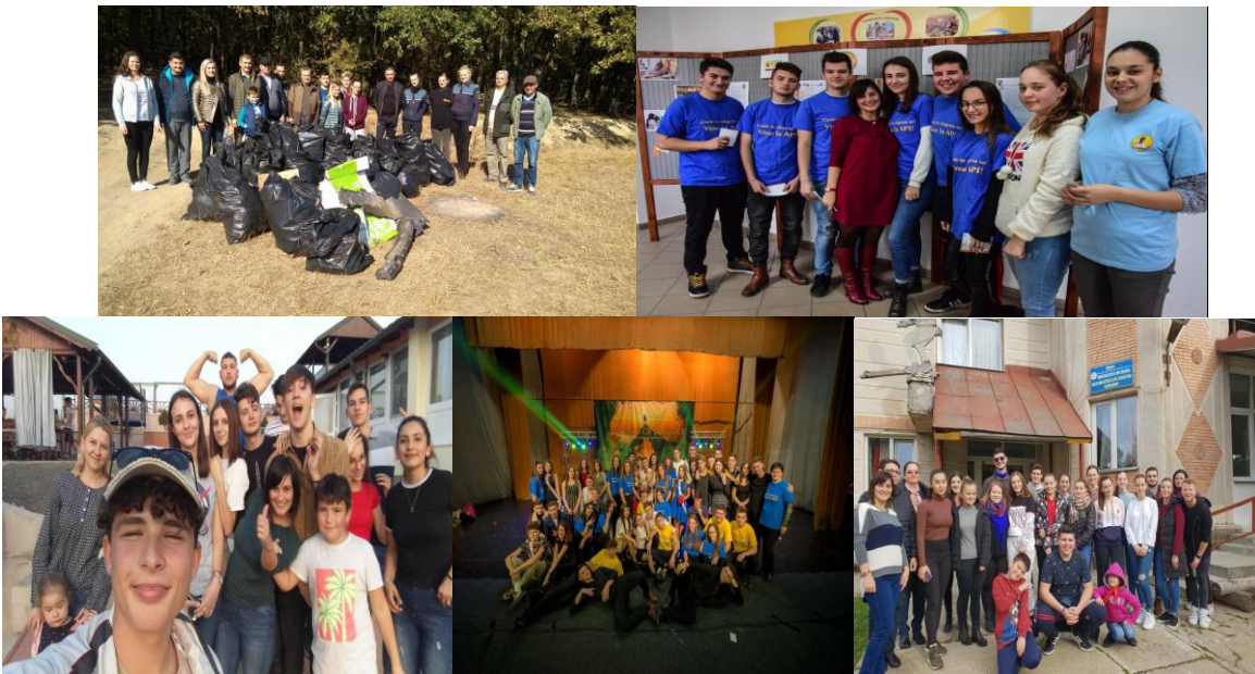
Imagini de la activitățile desfășurate în cadrul proiectelor de parteneriat