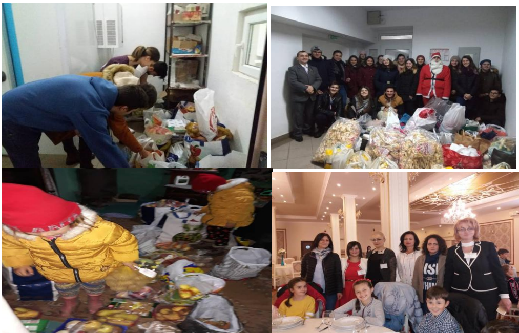
Imagini de la activitățile desfășurate în cadrul Strategiei Naționale de Acțiune Comunitară

Și în acest an am avut responsabilitatea de a coordona la nivelul școlii Comisia SNAC, în cadrul căreia s-au realizat acțiuni de voluntariat desfășurate pe parcursul întregului an școlar: „Săptămâna fructelor și legumelor donate”, „Poți fi și tu un Moș Crăciun”, „Pentru tine, un măștișor de la API!”, „Obiceiuri și tradiții de Paște - încondeierea ouălor de Paște”. De asemenea, am făcut parte din echipa de organizare a Concursului Național de Dans „Împreună pentru viitor” – etapa regională.