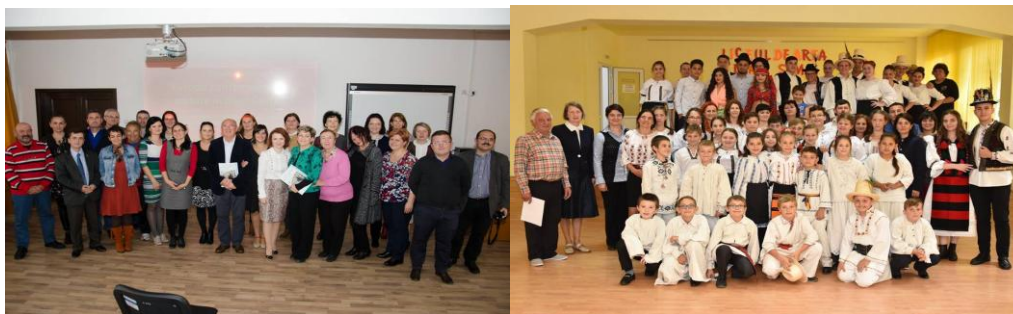
Imagini de la activitățile desfășurate în cadrul proiectului „Unitate în diversitate”

Un alt proiect cu tradiție în școala noastră este proiectul „Unitate în diversitate”, proiect înscris, de asemenea, în Calendarul Activităților Regionale și Interjudețene 2019, realizat în colaborare cu parteneri locali și regionali. Proiectul își propune implicarea elevilor de liceu în activități după cum urmează: „Educația pentru valori – Holocaust - cum a fost posibil?”, Șezătoare tematică „Slobozi-ne gazdă-n casă!”, „15 pentru Eminescu și cultură”, Seri culturale la API, Concursul regional „Schimbarea e în noi!”, iar beneficiarii direcți ai proiectului sunt elevii din clasele a X-a și a XI-a de la Colegiul Tehnic „Alesandru Papiu Ilarian” Zalău și un eșantion de 15 elevi din fiecare școală din județele partenere. Considerăm că produsele finale ale acestui proiect au contribuit la dezvoltarea și îmbunătățirea unor competențe și abilități ale elevilor privind comunicarea și acceptarea interdependențelor într-o lume multiculturală.