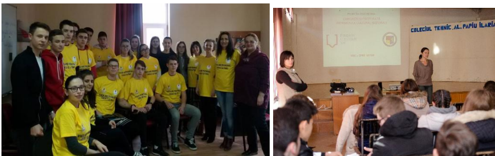
Imagini de la activitățile desfășurate în cadrul proiectului "Viața are prioritate. Cheia e la tine!"

La fel ca în fiecare an, la Colegiul Tehnic „Alesandru Papiu Ilarian”, am continuat tradiția în a implementa și coordona proiectul „Viața are prioritate. Cheia e la tine!”, proiect înscris în Calendarul Activităților Regionale și Intejudețene 2019. Beneficiarii acestui proiect au fost un număr de 100 elevi ai școlii, din clasele IX-XI. Proiectul constă în desfășurarea unor activități preventiv – educative, privind motivarea elevilor în vederea reducerii absenteismului școlar și a comportamentelor delincvente, prin stimularea creativității și prin dezvoltarea competențelor de comunicare lingvistice, matematice, informatice, muzicale, artistice etc. Aceste activități au fost realizate în parteneriat cu Inspectoratul de Poliție Județean Sălaj – Biroul de prevenire și combatere a criminalității, Centrul de Prevenire, Evaluare și Consiliere Antidrog – Sălaj, Direcția Județeană pentru Sport și Tineret Sălaj.