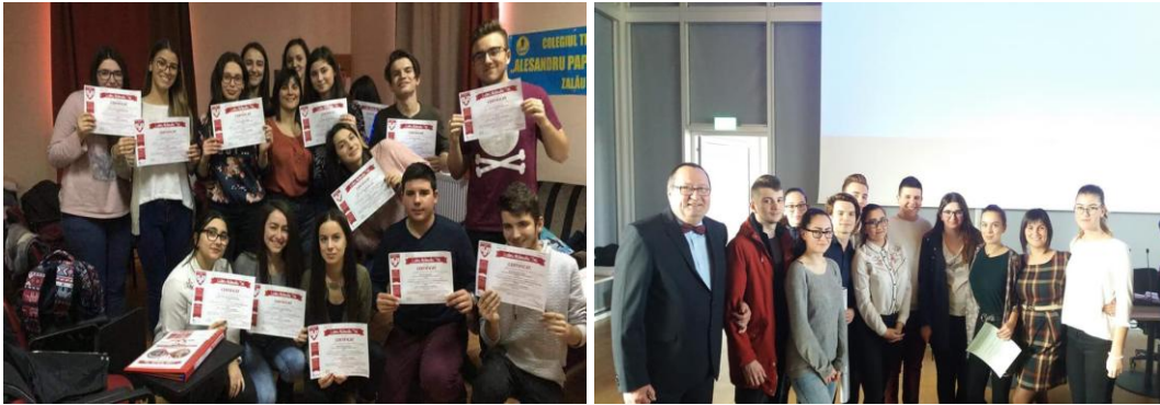
Imagini de la activitățile desfășurate în cadrul Programului „Liderii Mileniului Trei”

etc. Câteva teme sugestive din programa modulului „Schimbarea e în noi” sunt: „Valorile din viața mea”, „Cum comunic cu ceilalți”, „Eu și... emoțiile mele”, „Am încredere în mine”, „Forța echipei: toți pentru unul și unul pentru toți”.