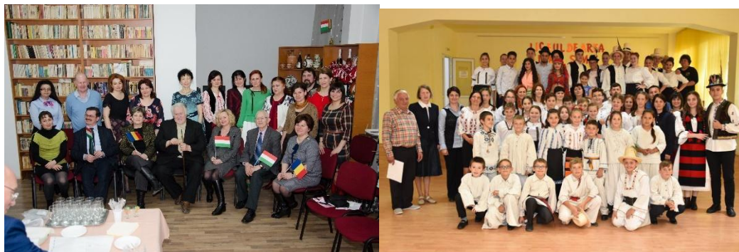
Imagini de la activitățile desfășurate în cadrul proiectului „Europa contemporană - unitate în diversitate”

Proiectul „Europa contemporană - unitate în diversitate” are ca scop: cunoașterea valorilor perene ale civilizației românești și ale celei europene, cultivarea respectului față de aceste valori, formarea deprinderilor de utilizare a acestor valori în situații de viață; dezvoltarea și valorificarea activităților de creație științifică, tehnică și cultural - artistică.