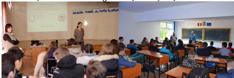
Imagini de la activitățile desfășurate în cadrul proiectului „Viața are prioritate. Cheia e la tine!”

Proiectul „Viața are prioritate. Cheia e la tine!” își propune dezvoltarea și diversificarea unor strategii care să conducă la prevenirea și combaterea absenteismului școlar și a factorilor de risc care conduc la apariția comportamentelor delincvente și creșterea motivației elevilor de a-și continua studiile, prin organizarea unor activități specifice în cadrul ședințelor de consiliere individuală sau de grup și în cadrul orelor de dirigenție, precum și activități cu profesorii și părinții la care să participe specialiști din domeniile de interes.